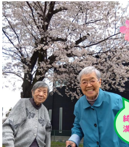
綺麗だね～ 満開だね～