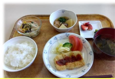
ハンペンのチーズフライ・わかめスープ 鶏肉とかぶの炊き合わせ・うどの中華和え