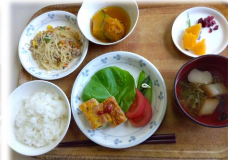
スペイン風オムレツ・南瓜の甘煮 ビーフンの中華炒め・味噌汁