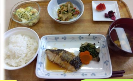
味噌煮魚・ポテトサラダ れんこんのきんぴら・清汁