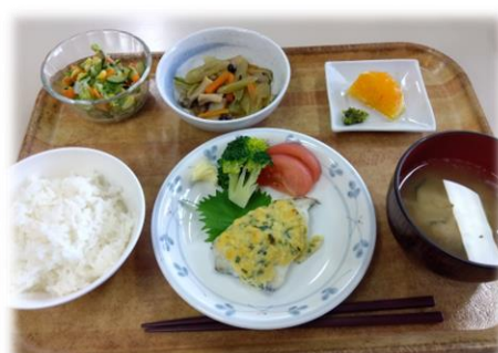
お魚の若草焼き・ふきのきんぴら コールスローサラダ・味噌汁