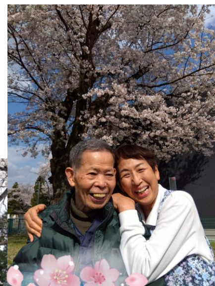
素敵なツーショット写真も撮れました♪