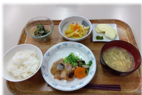
鶏の味噌焼き・リョネーズポテ ほうれん草の胡麻和え・中華スープ