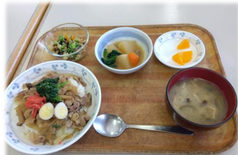
豚丼・味噌汁・大根と蒟蒻の味噌煮・キャベツの塩昆布和え

当デイでは厨房がフロアに隣接しており、調理をしているスタッフの様子を見ることができます。きざみ食やミキサー食などにも対応しています。同じメニューでもこんなに違いがありますが、どちらも栄養と愛情はたっぷり入っています♪